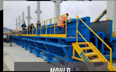
MOULD for Columns