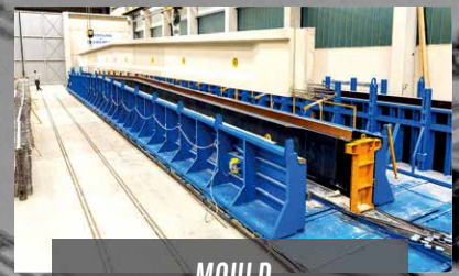
MOULD for Prestressed Beams