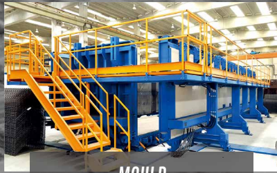
MOULD for 3D Element