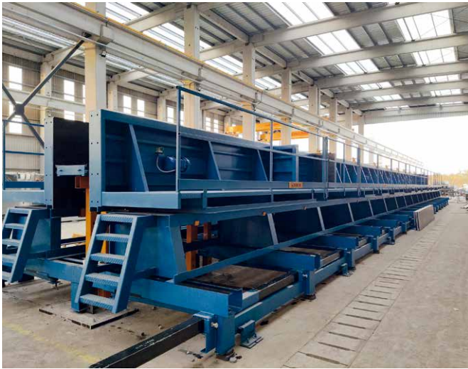
长 32 米的可调节式立柱模具