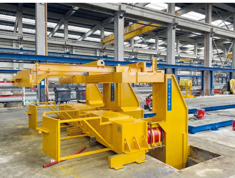
重 800 吨的松弛基台