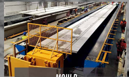
MOULD for Slabs