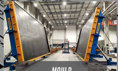
MOULD for Wall Panels