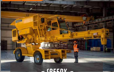
- SPEEDY - Concrete Distribution