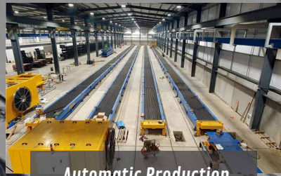
Automatic Production Lines