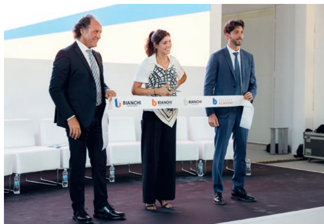
Uroczyste przecięcie wstęgi Bianchi Prefabbricati.