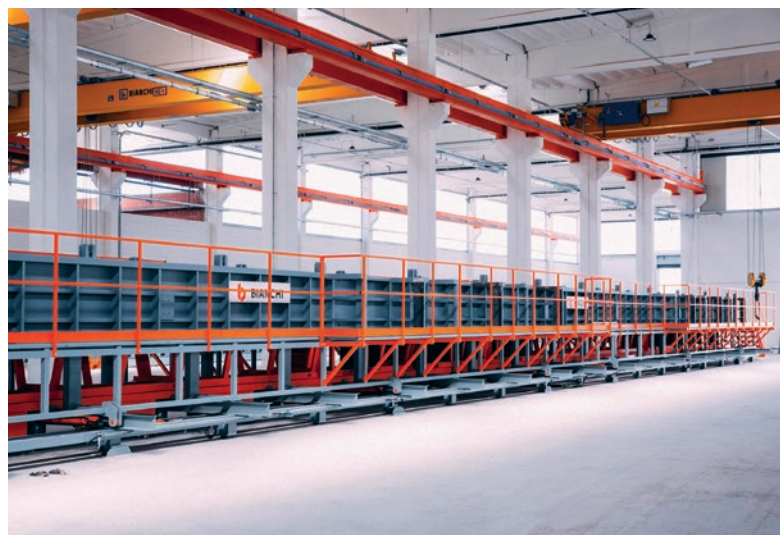
Wielosekcyjna forma słupowa.

Dzięki synergii technicznej między działami „Bianchi Prefabbricati” a „Bianchi Technology for Precast”, klienci będą mieli okazję zobaczyć i dotknąć maszyny podczas pracy, przeprowadzić sesje szkoleniowe oraz zaczerpnąć wiedzy specjalistycznej od naszych techników.