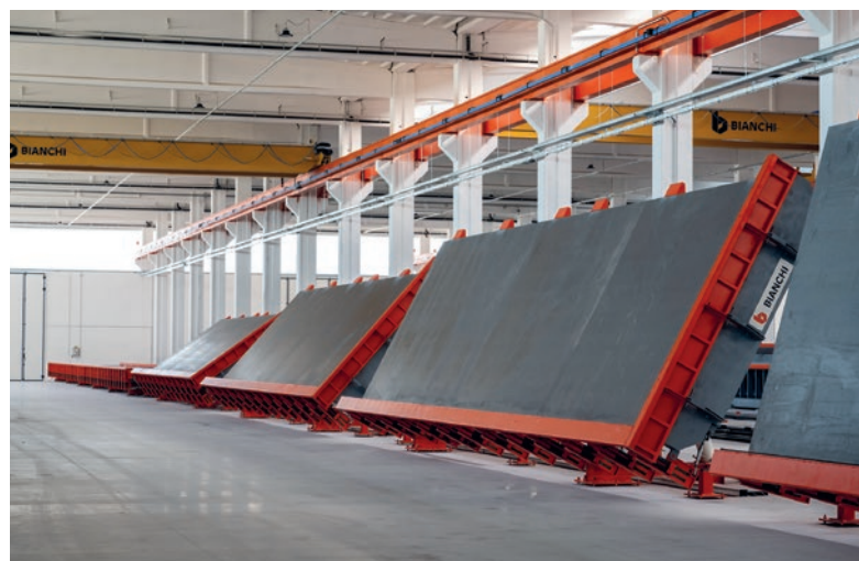
Stoły do produkcji płyt.

produkcyjnego „Bianchi Prefabbricati” podczas ceremonii otwarcia, która odbyła się 4 września br. Zbudowany w ciągu kilku miesięcy nowy zakład na działce o powierzchni około 100 000 metrów kwadratowych w Colorno (Parma) plasuje się w czołówce podobnych zakładów, a to dzięki najnowocześniejszemu sprzętowi produkcyjnemu wykorzystującemu najbardziej innowacyjne technologie skrojone na