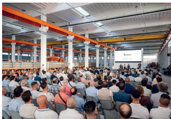
Wydarzenie inauguracyjne ze sceną i publicznością.