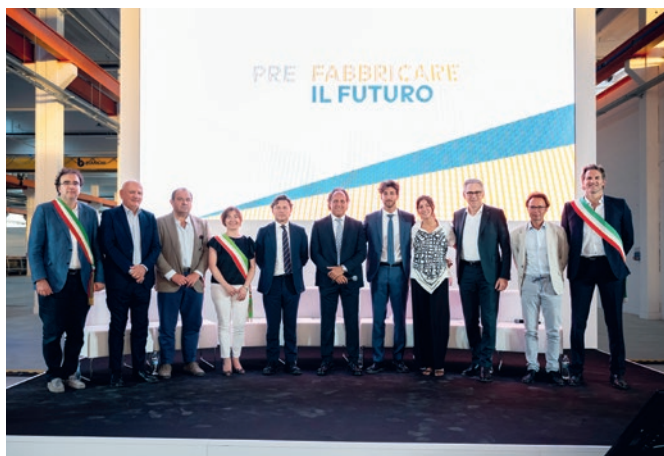
Końcowe zdjęcie na imprezie inauguracyjnej.