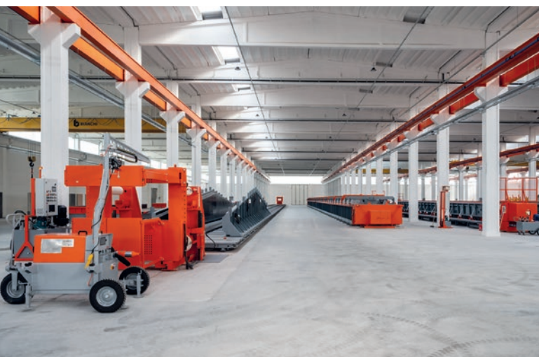
Widok ogólny deskowania, belki podsuwnicowej i deskowania skrzydłowego.